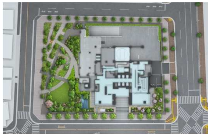
▲敷地配置イメージイラスト

周辺には学校や教育施設、医療機関、商業施設が点在し、都心近接でありながら落ち着いた暮らしを支える生活環境が整っています。