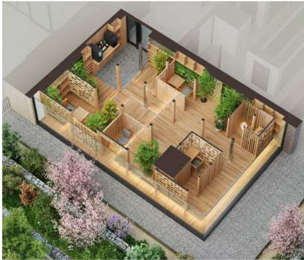
▲ラウンジ完成予想 CG