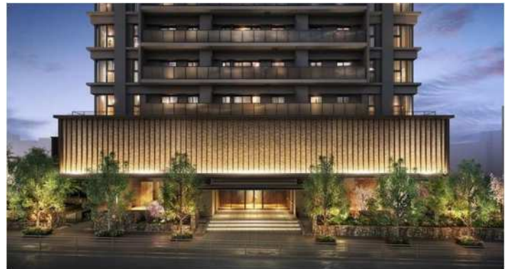
▲グランドエントランス完成予想 CG

※1：1995年以降に天王寺区内で発売された分譲マンションのうち、地上42階建の本物件が最高層となります。