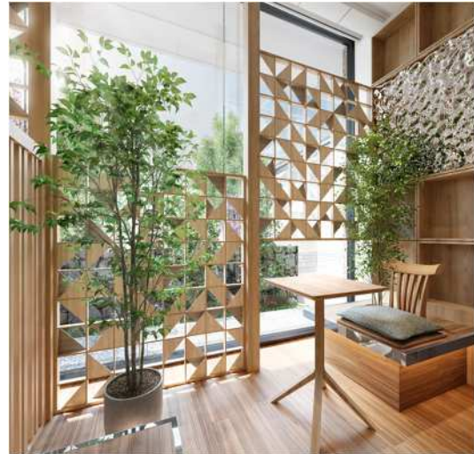
▲ラウンジ完成予想 CG