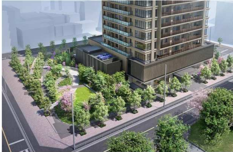
▲シーズズガーデン完成予想 CG