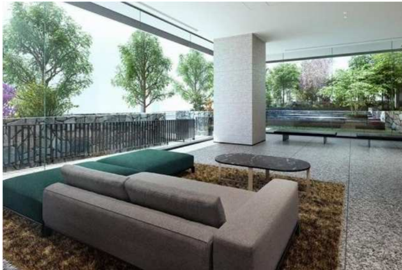
▲ガーデンラウンジ完成予想 CG

都市居住の快適性を高めるとともに、暮らしにさらなる豊かさと上質な時間をもたらします。