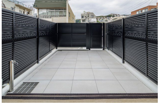
専用テラス (1階住戸)