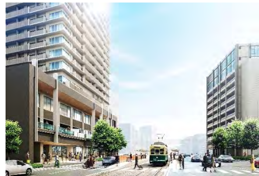
(左) 北街区 (右) 南街区

本事業は、新大工町商店街を含む中心市街地の活性化実現を目的に推進している再開発事業であり、そのうち分譲マンションの開発をJV5社で推進しています。国道34号と長崎電気軌道「新大工町」電停徒歩1分に位置し、利便性の高いエリアです。北街区には商業施設と住宅、国道34号を挟んだ南街区には駐車場と業務施設を設け、二つの街区は新設される歩道橋でつながる予定です。本マンションは、北街区に建設される地下1階・地上26階建て複合ビルの4階から26階に位置し、長崎県内最高峰 ※1 タワーマンションとなります。