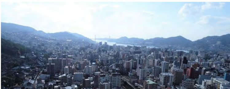
高層階からは長崎湾を一望

※2 「クワッドロックシステム」はエントランスから玄関までの四重のセキュリティのことを指します。