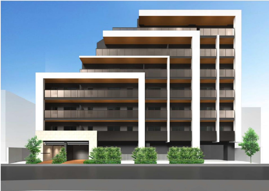
【(仮称)プレディアコート西葛西 外観イメージ】