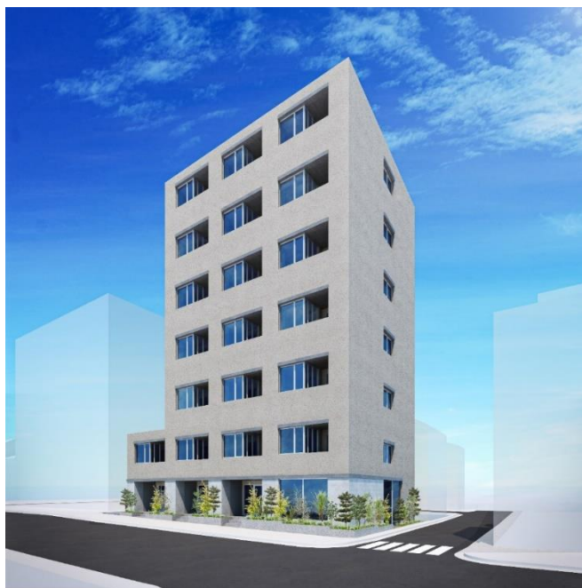
【(仮称)プレディアコート清澄白河 外観イメージ】

当社はこれからも「安全・安心・豊かな暮らし」を実現し、お客様の人生に寄り添い、快適でより良い品質・サービスを提供いたします。