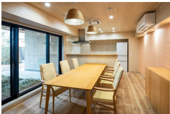
ファミリールーム

壁や天井に天然木の突板クロスを使用し、中庭に面して大きな吹き抜け空間を設けることで、木のぬくもりを感じながら、緑を眺めて楽しむことができる開放的なエントランスラウンジ