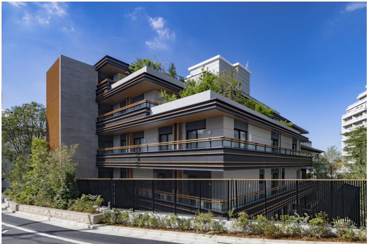
屋上緑化を施し立体的な緑を形成することで周辺環境との調和を目指した建物外観（東側）