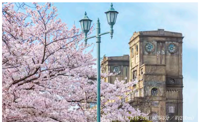
□根岸森林公園(徒歩3分/約210m)