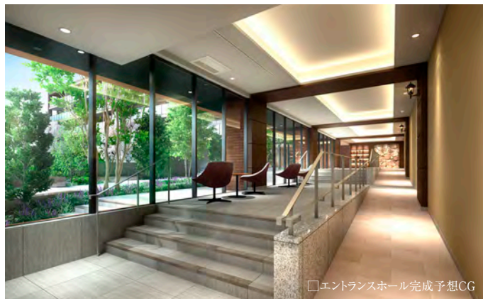
□エントランスホール完成予想CG