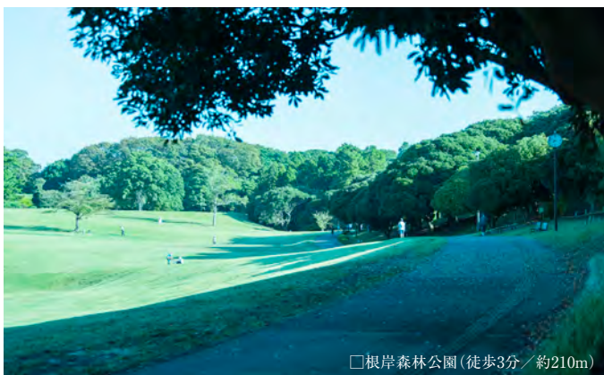
□根岸森林公園(徒歩3分/約210m)